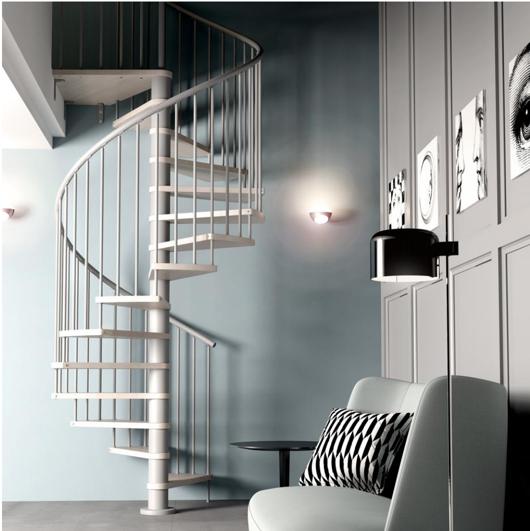
Wenteltrap Type "Capri" (met extra hardhouten treden)